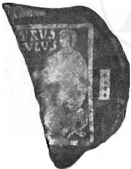
Fig. 11. — Frammento di vetro dorato con le figure di Pietro e Paolo.