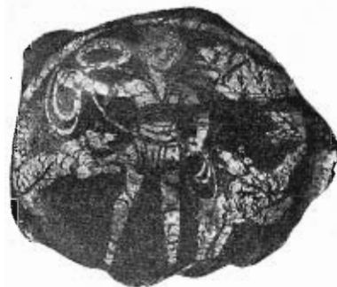
Fig. 15. — Vetro dorato con la figura di un bestiarius .

Il circense, o più propriamente il bestiarius qui rappresentato, è imberbe ed indossa la stretta tunica o χιτών ἡμοχιμῶς o vestis quadrigaria propria degli aurighi, cioè con le varie striscie di cuoio legate attorno al torace e con allacciature attorno alle gambe (4). Piuttosto che la esegesi del GARRUCCI, secondo cui sarebbe qui rappresentato il custode delle fiere, il quale, finito lo spettacolo, si accinge a ricondurle nelle gabbie gettando loro il laccio, dobbiamo seguire l'avviso del VOPEL, per cui sarebbe qui effigiato un domatore dell'arena nell'atto di gettare il laccio su tre fiere, che gli si avventano contro. Ciò si desume non solo dal vestito e dall'azione del personaggio, non solo dall'atteggiamento delle bestie, a quel che pare tre orsi, ma anche dalla corona collocata a sinistra della testa del bestiarius e che è simbolo di vittoria.