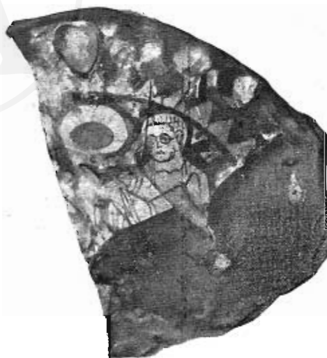
Fig. 12. — Frammento di vetro dorato con le figure di Pietro e Paolo. (Riproduzione invertita per ragioni di chiarezza).