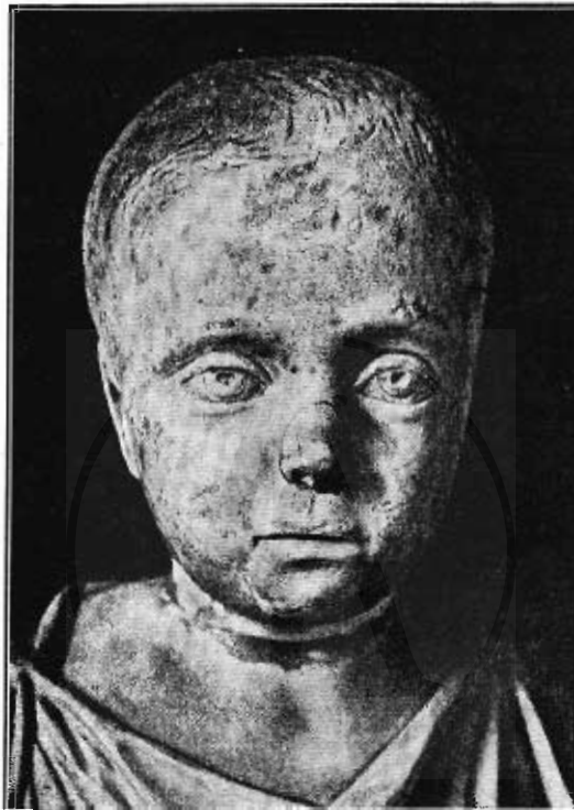
Fig. 3. — Testa marmorea di bambino di Sion House.

Mi pare che si possano addurre due teste marmoree, le quali tuttavia rappresentano bambini di età più progredita; cioè la testa della via Latina ora nel Museo del Palazzo dei Conservatori (1) e la testa di Sion House in Inghilterra (2). La prima presenta analogia per l'accentuato gonfiore delle gote e per la modellatura sinuosa delle labbra; la seconda (fig. 8) per la parte superiore del volto con la chioma cortissima ed all'ingiù,