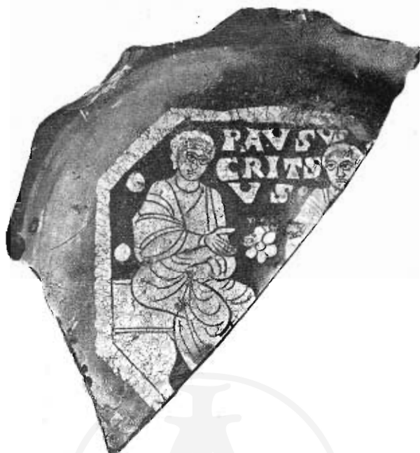
Fig. 10. — Vetro dorato frammentario con le figure di Cristo e di S. Paolo.

ha il motivo, nella cornice circolare, di triangoletti accostati (1); in questo ultimo vetro tra i due Apostoli è una corona (2), simbolo di vittoria per il martirio sofferto.