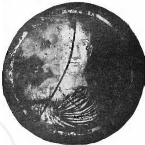
Fig. 4. — Vetro dorato col busto di un giovane.

Dentro una semplice cornice circolare è il busto di un personaggio imberbe di fronte, che indossa la toga al disopra della tunica, di cui appare una parte sotto il collo a sinistra. La moda qui seguita di ripiegare la toga in maniera che il rimbocco del sinus , tirato assai in alto, dalla spalla sinistra discende e si ripiega sotto l'ascella destra formando quasi un groppo, sembra che si manifesti sin dall'età adrianea (1) affermandosi poi sotto gli Antonini. Ma è la moda che in maniera più accentuata appare seguita nelle due celebri statue consolari del Museo del Palazzo dei Conservatori, provenienti dalle vicinanze immediate del « tempio di Minerva Medica » (2), e nella ormai celebre statua di imperatore imberbe dalle terme di Afrodizia in Caria, ora nel Museo Ottomano di Costantinopoli (3). Per le due statue consolari le date proposte vanno dall'età costantiniana alla prima metà del secolo V; per la statua imperiale di Afrodizia è stata proposta la identificazione di Valentiniano II (382-392) dal Delbrueck (4) e, dubitativamente, dal Rodenwaldt, quella invece di Valentiniano III giovinetto, all'età del suo matrimonio con Eudossia (a. 437), dall'Albizzati.