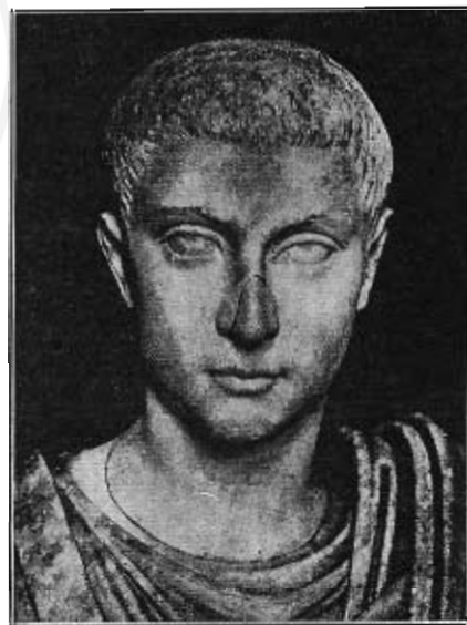
Fig. 6. — Testa marmorea di giovane di Lansdowne House.

Coi volti rappresentati su questi due vetri mi pare che presenti analogia l'allungato volto, un po' scarno, di un ritratto marmoreo di giovane di Lansdowne House in Inghilterra (2). Il Poulsen, pubblicando questo marmo (fig. 6) dalla fine modellatura delle guancie e della bocca, accentua lo sguardo fisso degli occhi spalancati, per cui si sarebbe indotti a vedere in esso un prodotto ormai del sec. IV; ma egli è trattenuto dal fissare questa data ed è incline a pensare alla metà del sec. III per il trattamento della chioma, che è con le striature scarsamente incise e col fiacco loro contorno, peculiare dei prodotti