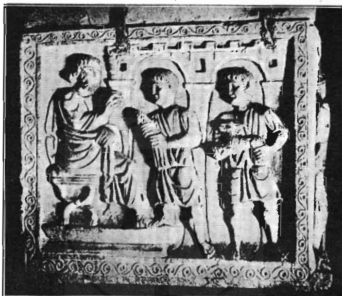
Fig. 13. — Uno dei lati minori del sarcofago dei SS. Simone e Giuda in S. Giovanni in Valle a Verona.

Al secolo IV progredito, al tempo del Cristianesimo ormai trionfante, possono risalire i tre vetri aurei bolognesi n. 5-7, in cui si constata una esecuzione assai più grosso-