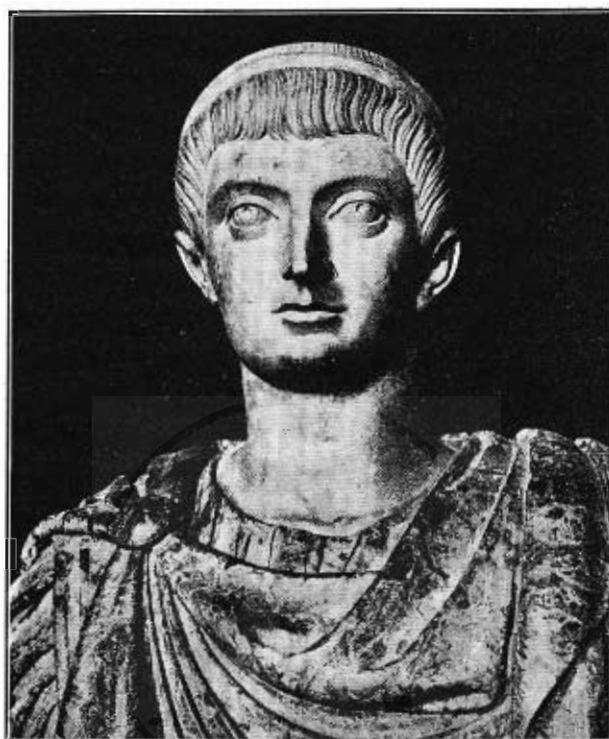
Fig. 7. — Busto del Museo del Louvre detto di Costantino Magno.

Ma forse i due vetri n. 2 e n. 3 sono ancor più recenti. La fissità dello sguardo resa con l'ampio globo oculare, che reca esattamente nel mezzo il cerchiello della pupilla,