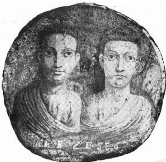
Fig. 5. — Vetro dorato coi busti di due giovinetti.

Dentro una semplice cornice circolare sono i busti di due giovinetti di prospetto: sopra la tunica recano essi la toga che, nel personaggio di sinistra ricopre la spalla de-