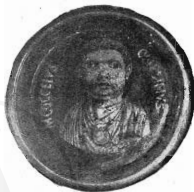
Fig. 2. — Vetro dorato col busto di M. Cocceio Onesimo (ingrandito).

ritratte con senso di verità, qualche cosa che lo avvicina nella espressione più ad un leggiadro e festevole cagnolino che ad un essere umano. È lo inizio dello sboccio umano, con lo spiritualismo ancora latente, è ancora lo stato larvale preannunziatore del passaggio alla fanciullezza briosa e spensierata. Onesimo non è ancora un frugolo o un monello, è tuttora un putto che ciangotta.