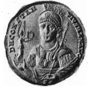
Fig. 8. — Medaglione aureo del Museo Britannico di Costanzo II.

Perciò, ritornando ai nostri due vetri dorati n. 2 e n. 3, la data della loro esecuzione può cadere nel primo cinquantennio del secolo IV; da un lato l'acconciatura della chioma ci vieta di discendere più oltre, d'altro lato non possiamo disconoscere che l'allungamento del volto delle figure dei nostri vetri ha il suo confronto con l'allungamento del volto presentato rigorosamente, se non sempre di profilo, nelle monete da Costantino in poi, mentre nelle monete dei precedenti tetrarchi è la opposta sagoma del volto, corta e grossa (2). L'aureo medaglione del Museo Britannico di Costanzo II (3), che nel dritto (fig. 8) rappresenta quasi del tutto di prospetto il busto dell'imperatore armato con l'attributo della Vittoria, è un assai raro esempio della riproduzione di fronte di un volto imperiale nelle monete; perciò può essere addotto a rincalzo della data qui proposta per i due vetri dorati bolognesi.