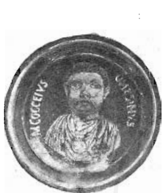
Fig. 1. — Vetro dorato col busto di M. Cocceio Onesimo.

Ma veramente curioso è il piccolo Onesimo (= colui che dà utilità o, meglio, gioia) del vetro bolognese. Si tratta di un bambino in assai tenera età, in cui i tratti del volto non sono ancora del tutto formati o fissati; da ciò deriva che il visetto infantile qui rappresentato è paffuto assai, rotondetto, con una boccuccia, dai grossi labbruzzi a ventosa, sì da serbare quasi la impronta dell'abitudine di succhiare il latte, col nasuccio quasi rigonfio dalle narici aperte, con gli occhi che fissano con ingenua chiarezza e con franca confidenza. Questo bimbetto che ha una di quelle faccine infantili che siamo soliti a paragonare ad una rosea mela, dimostra nelle sue caratteristiche infantili, gustosamente