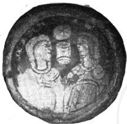
Fig. 16. — Vetro dorato coi busti della Vergine e di S. Agnese. (Riproduzione invertita per ragione di chiarezza).

La Vergine Madre di Dio e la fanciulla martire Agnese sono qui rappresentate l'una di fronte all'altra nella parte superiore del corpo. Precede il nome di Agnese a